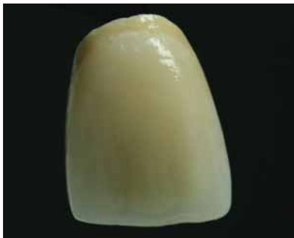
Рис.8 Вестибулярная поверхность резца с выделенными мамелонами и пришеечным эмалевым валиком

Техника контрастов добавляет выразительность и оптическую объёмность, что особо эффективно при недостатке места для керамической облицовки. (рис. 9).