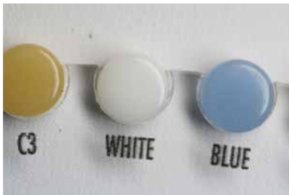
Pic.5 Dentin Modifier White