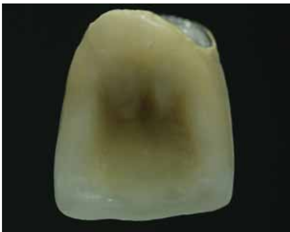
Рис.7 Оральная поверхность резца с контрастами