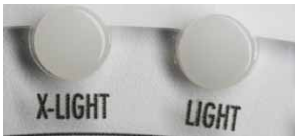
Pic.1 Natural Enamel Light, Natural Enamel Extra Light

Снизу вверх эмалевые массы для достижения более значительного эффекта. Dentin modifier White (исключение) обеспечивает контраст наибольшей интенсивности.