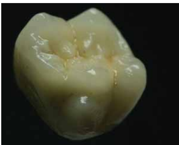
Рис.6 Жевательная поверхность моляров с контрастами