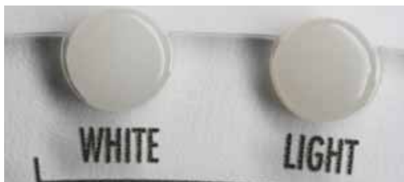
Pic.2 Opal Enamel White