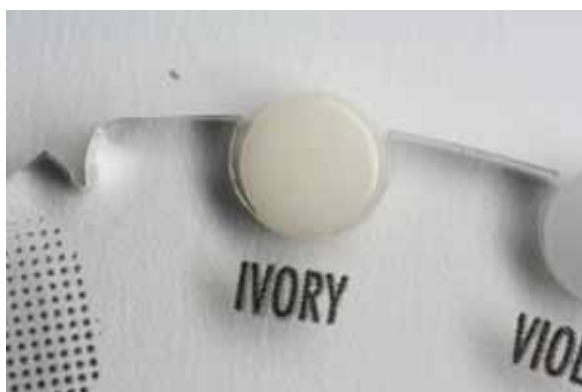
Pic.4 Natural Enamel Ivory