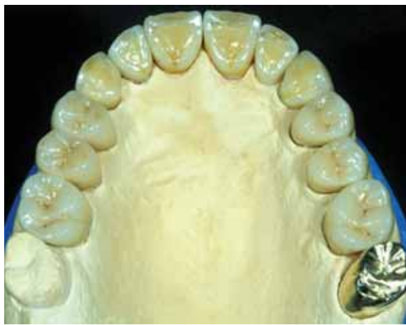
Рис.8 Вестибулярная поверхность резца с выделенными мамелонами и пришеечным эмалевым валиком