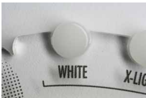
Pic.3 Natural Enamel White